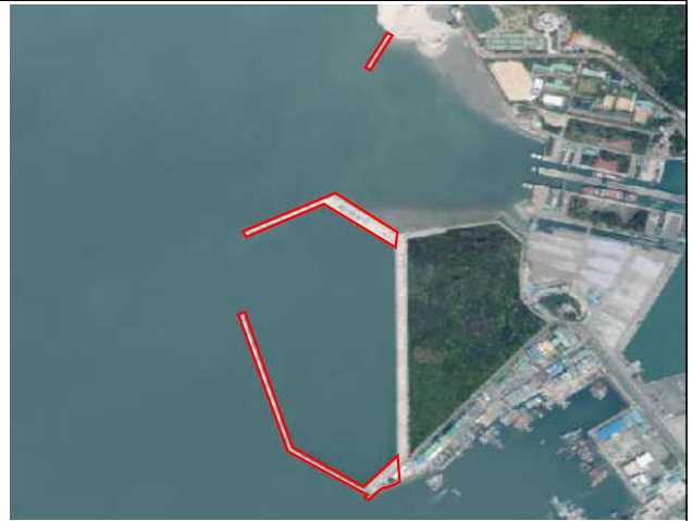
인천항 방파제 및 항만시설 신규등록(0.3 km 2 )