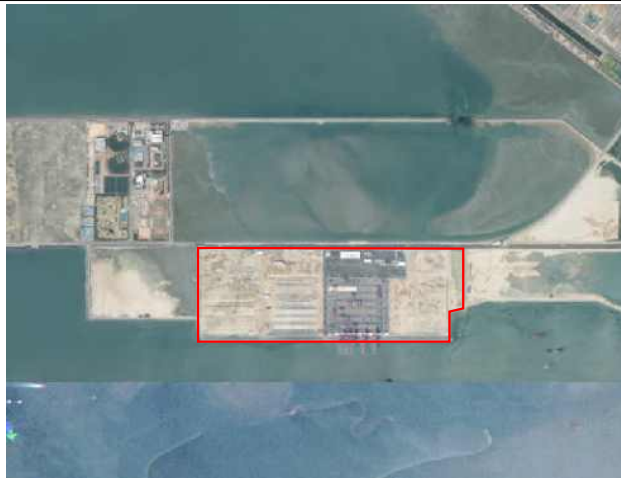
인천신항(10공구 및 바다쉼터) 신규 등록(1.0km 2 ) 등