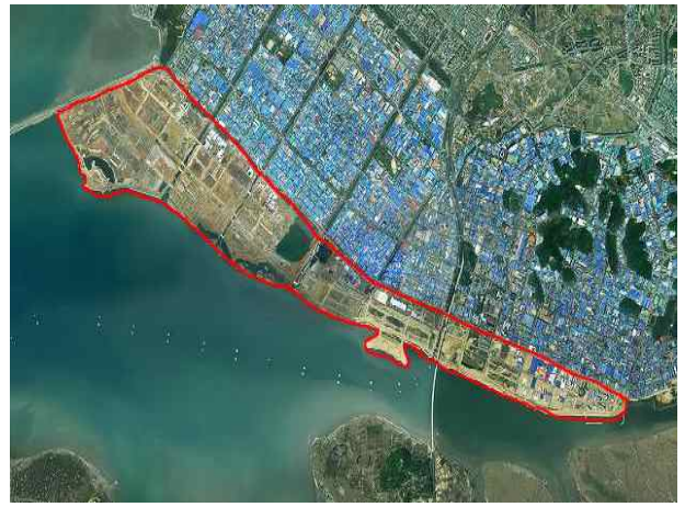
경기도 안산시·시흥시 구획정리(시화MTV) 사업 완료(1.9km 2 )