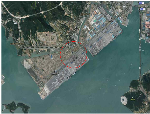
전남 광양시 황길동 공유수면매립 및 토지개발사업 (3.9km 2 )